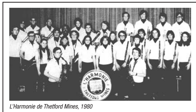
L'Harmonie de Thetford Mines, 1980

Le début du nouveau Concours devient donc le point de départ d'un renouveau pour la Fédération des harmonies et des orchestres symphoniques du Québec.