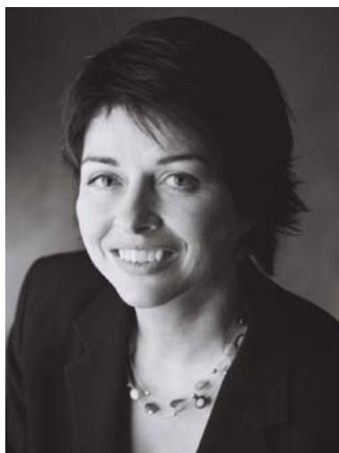
Jean Charest Premier ministre du Québec

Félicitations pour ce 75 e anniversaire et excellent festival à tous!