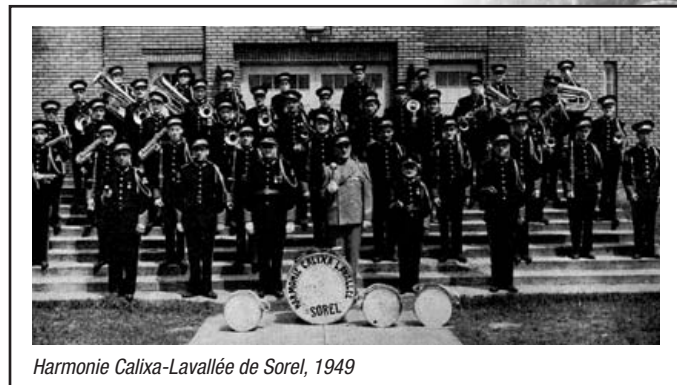
Harmonie Calixa-Lavallée de Sorel, 1949

Festival des harmonies du Québec et le Concours Solistes et petits ensembles de la FHOSQ qui se tiendront, pour le premier, à Sherbrooke en mai et, pour le deuxième, à Victoriaville en avril.