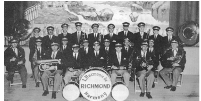
L'Harmonie de Richmond, 1962