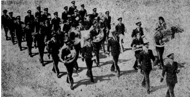
Fanfare d'Arvida, 1957

En 1927, à l'occasion du cinquantenaire de la fondation de l'Union musicale de Trois-Rivières, plusieurs fanfares (comme on les appelait à l'époque) du Québec manifestèrent dans la Cité de Lavolette et la fête se termina par un grand banquet qui réunit les sommités musicales de Trois-Rivières et de la province.