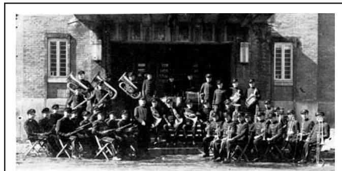
Cercle philharmonique de Saint-Jean, 1949

À compter de 1953, des concours de fanfares scolaires et de jeunes débutèrent à Thetford Mines avec la participation de 5 sociétés musicales. On compte aujourd'hui plus de 170 harmonies juniors qui participent au Festival.