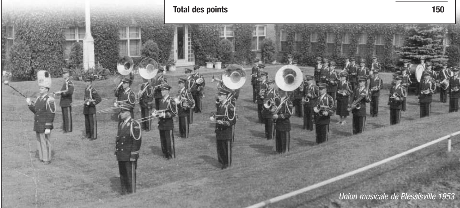
Union musicale de Plessisville 1953