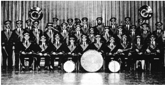
Fanfare de Waterloo

Entre 1934 et 1940, l'Association va tenir six festivals. Il ne semble pas y avoir de documents ou de récits sur cette Association après 1940.