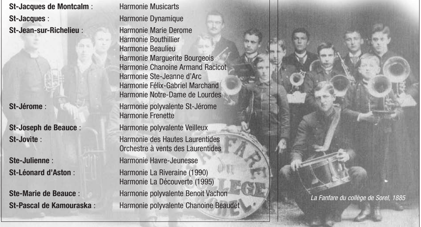
La Fanfare du collège de Sorel, 1885