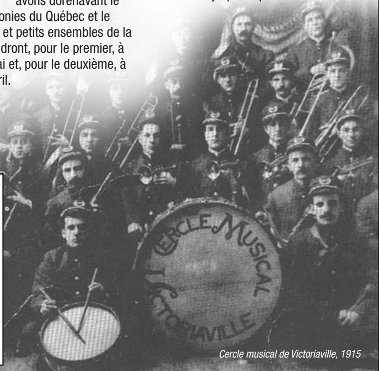
Cercle musical de Victoriaville, 1915