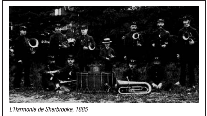
L'Harmonie de Sherbrooke, 1885