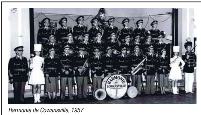
Harmonie de Cowansville, 1957