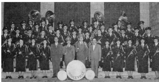
L'Harmonie de Princeville Furniture