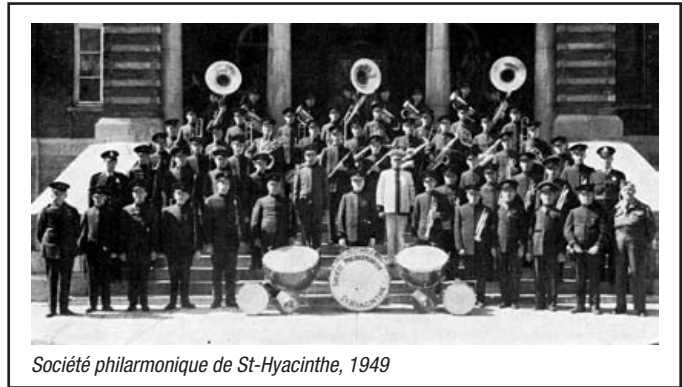
Société philharmonique de St-Hyacinthe, 1949