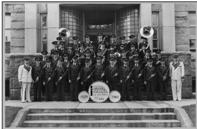
Harmonie de Granby, 1949 Société d'histoire de la Haute-Yamaska

À tous nos collaborateurs, supporteurs, commanditaires et bénévoles !